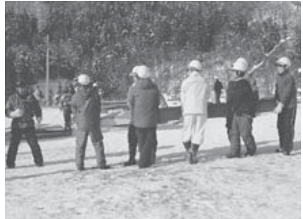
社殿造りは社殿棟梁や保存会の指揮のもと、すべて共同作業で行われる。

まず、秋に伐り出され、日影ゲレンデに保管されていた御神木2本が、道祖神祭り2日前の1月13日に祭り会場に運ばれる。これが「御神木里引き」である。御神木里引きは、野沢の温泉街を抜け、道祖神会場の馬場の原までおよそ2kmの行程で行われる。途中、神木の滑りが悪くなると、代表が音頭をとり「ツルツルット、ヨイヤサノサー」と氣勢を上げて引っ張り、段差のあるところでは、全員で大木を持ち上げ運ぶこともある。沿道の家からは御神酒を奉納され、その都度大声で披露し道祖神の手締めが行われ、見守る人々に御神酒が