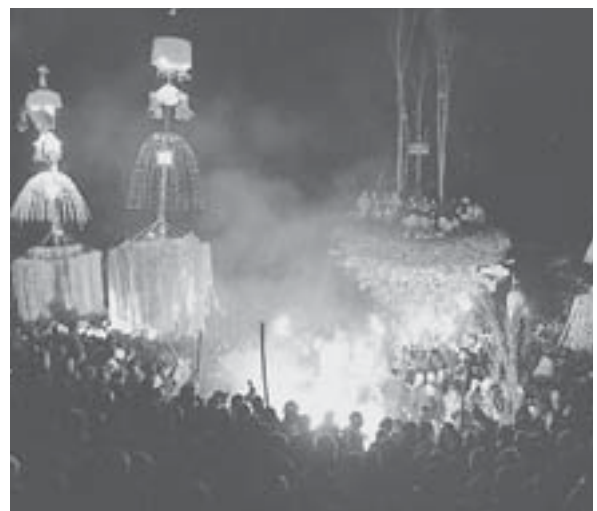
野沢温泉の道祖神祭り当日風景。