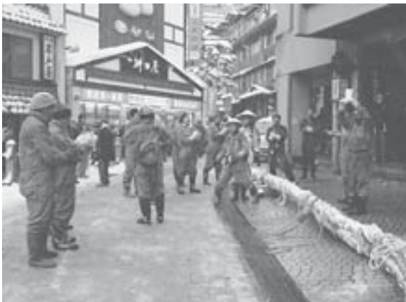
御神木里引き途中、沿道の家から御神酒が奉納されると、声高らかに「〇〇様より御神酒2升」などと披露し、一同でお礼の手締めをして村人やお客様に御神酒を振舞いながら引き歩く。