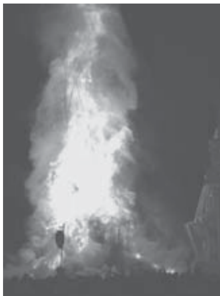
燃え上がる道祖神社殿。