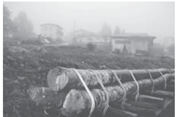
祭り当日は雪で覆われる祭り会場「馬場の原」。手前が祭りを待ち保管されるブナの大木。