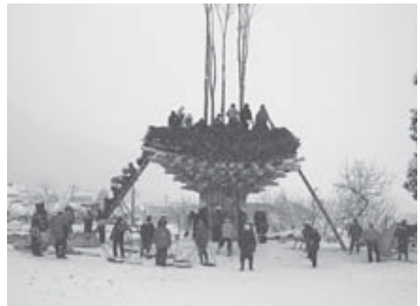
社殿に厄年が乗る部分の高さは約7m。御神木の上部はさらに10mほど突き出ている。