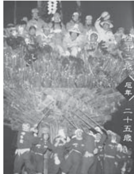
社殿上部に社殿に登れるのは、野沢温泉に生まれた男子でも一生のうち一度、42歳の本厄を迎えたときだけ。25歳厄年は社殿下で松の枝一本のみで村人のたいまつに立ち向かう。

すると、会場の火元となるボヤに点火され、ここからいよいよ祭り本番。火の攻防戦が始まる。