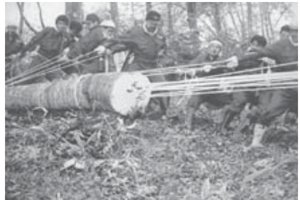
伐採したブナの大木は、1本あたり約20人で引き出す。すべて手作業であり、かなりの重労働である。こういった祭りの準備を含め一筋縄ではいかない作業に共に携わることによって三夜講および友達衆は絆を深めていく。

道祖神祭り会場にそびえる社殿は、厄年の男衆によって手作業でつくられ、その準備は前の年の秋から始められる。ブナのご神木をはじめ、桁、垂木になる材料、社殿最上層に積むボヤと呼ばれ