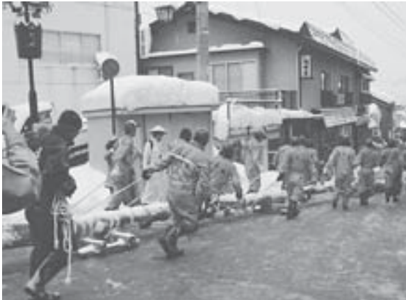
約2kmの行程を約3時間かけて引いていく。「ツルツルット、ヨイヤサノサー」という氣勢が温泉街にこだまする。