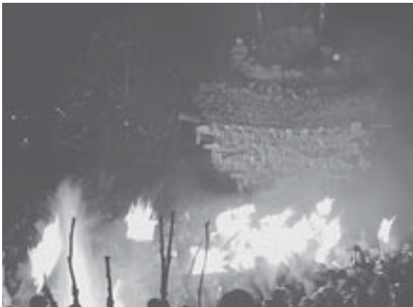
攻める側である村の男衆は、オンガラのたいまつに火をつけ社殿を攻める。

攻防戦が終わり社殿の上から厄年の男たちが降りてきた後、火が中心に入れられ、間もなく炎の柱がメラメラと立ちのぼり、夜空を真っ赤に染め上げていくのである。