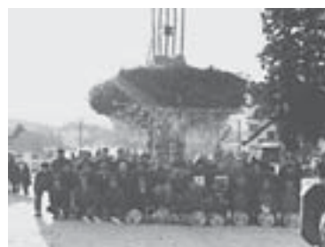
完成した社殿の前で記念撮影する三夜講のメンバー。

しかし、ここでふと疑問がわく。野沢温泉の道祖神祭りの三夜講は、42歳を過ぎるとメンバーからはずれ、新たな40歳が入るというローテーションではない。3年間同じ仲間でするというところに、互いの絆が深まり、「あいつがやるならオレもやらねば」と忙しい中でも何とか仕事を調整し