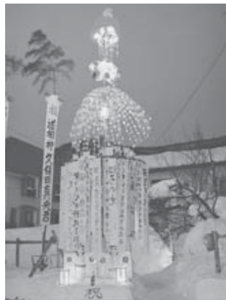
子どもの健やかな成長を願う初灯笼は、道祖神祭りのもう一つの主役である。

野沢温泉では、男児の初子が生まれると、道祖神祭りに初灯笼を奉納するのである。灯笼づくりは、灯笼棟梁の指揮に従って親戚や近所の方々、