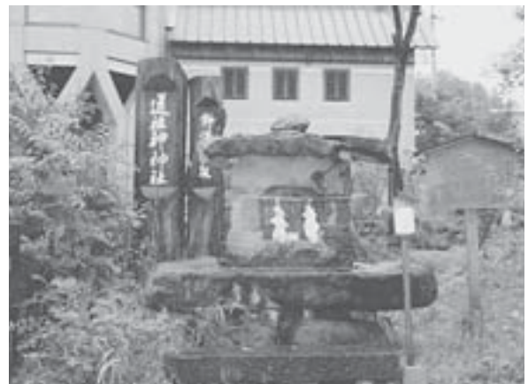
「野沢組」事務所前には、道祖神神社が祀られている