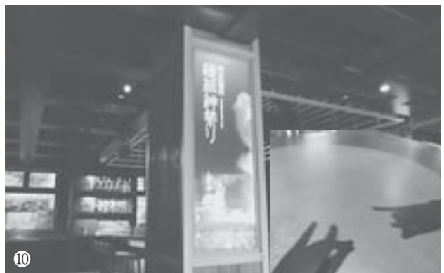
①外湯めぐりを楽しんでいた若い女性客 ②街中の至るところで見かけたこの看板。おもわず地元の人に何か尋ねたくなる？ ③足湯を楽しめる場所もあちこちに ④お店で卵を購入し、自分で温泉卵づくりも楽しめる ⑤野沢組が管理する源泉の一つ「麻釜（おがま）。地元民以外は立ち入り禁止だが、源泉からもうもうと立ち上がる湯けむりを眺めるだけでも心地よい ⑥この「麻釜（おがま）」の温度は約90度。地元民は野沢菜をはじめ、野菜や山野草をこの高温を利用して茹でている。⑦13ある外湯の一つ「松葉の湯」 ⑧浴衣姿で外湯めぐりも楽しめる。奥の建物は温泉街の中心にあり野沢温泉のシンボルとも言える外湯「大湯」 ⑨野沢温泉にはいくつかの温泉街があり、いろいろ巡るのも楽しい。⑩道祖神祭りをイメージしたバー。テーブルの上は炎をイメージした赤い照明になっており、影絵で遊ぶ家族連れもいた。