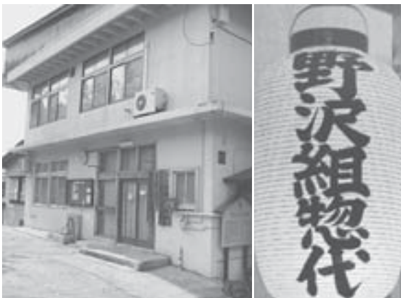
「野沢組」兼「野沢会」事務所。右は（左）とその前にある道祖神神社（右）

2000年には、市町村合併の動きを睨み、認可地縁団体法人 (※) 「野沢組」として法人化を図った。これにより、それまで名義は村で実質所有していた共有林などを名実ともに野沢組所有にし、組の役割継続を明確なものにしたのである。