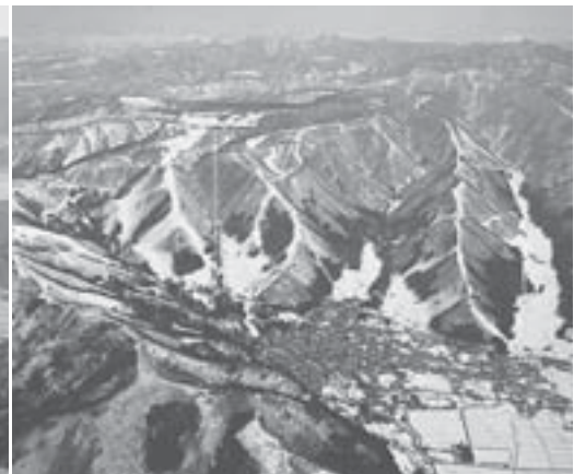
上ノ平高原途中に見晴台（野沢温泉街から車で20分）からのぞむ野沢温泉街（豊郷地区）（左）と野沢温泉スキー場全景（右）