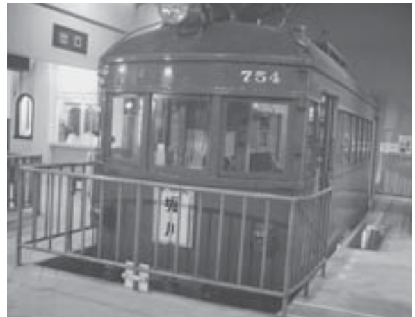
産業都市瀬戸の要・瀬戸電

目に飛び込むのが本物の「瀬戸電」。かつてやきものの輸送を一手に担ったこの電車は、落ち着いた緑の車体、板張りの床や青いピロード調の座席がレトロで懐かしい雰囲気をまとっています。瀬戸電の隣には昔の尾張瀬戸駅もジオラマ復元されており、駅舎を通り抜けると、積み荷を置くための集積所、モロと呼ばれる工場、石炭窯、瀬戸物