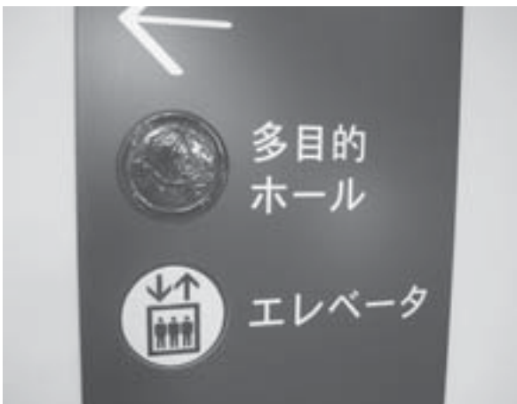
館内の案内サインも陶器製

目に飛び込むのが本物の「瀬戸電」。かつてやきものの輸送を一手に担ったこの電車は、落ち着いた緑の車体、板張りの床や青いピロード調の座席がレトロで懐かしい雰囲気をまとっています。瀬戸電の隣には昔の尾張瀬戸駅もジオラマ復元されており、駅舎を通り抜けると、積み荷を置くための集積所、モロと呼ばれる工場、石炭窯、瀬戸物