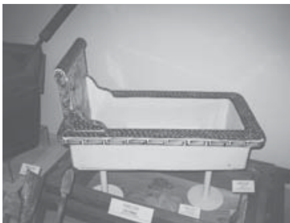
意匠を凝らした染付の便器

市内の施設では置物などの装飾品・ノベルティのテーマ館の「ノベルティこども創造館」、伝統技法の瀬戸染付をテーマにした「マルチメディア