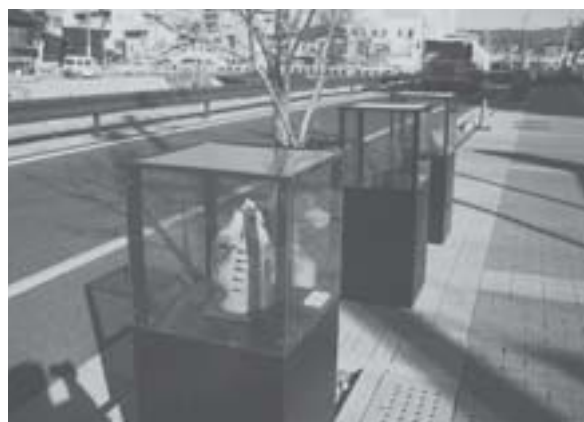
至るところに展示の仕掛けがある（尾張瀬戸駅周辺）

「街角ギャラリー」の募集など、せと・まるっとミュージアムの企画は多岐にわたっています。