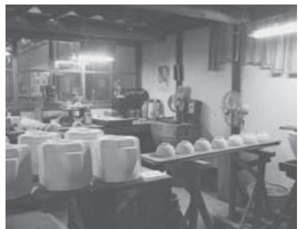
再現ゾーンにある工場風景