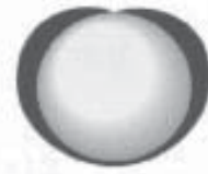
瀬戸蔵のシンボルマーク

それから瀬戸蔵のシンボルマークですが、真ん中の白い円は陶磁器のイメージ。また観光案内の中心施設であることを象徴しています。その周り