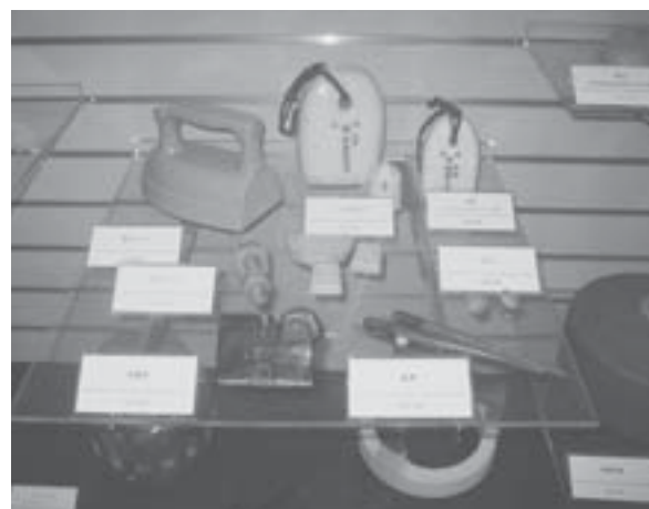
やきもの歴史はそのまま日本の生活史でもある