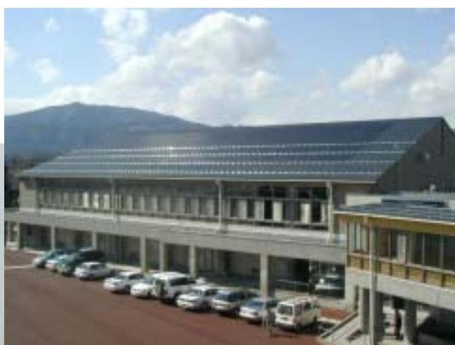
屋代中学校：体育館の屋根に設置