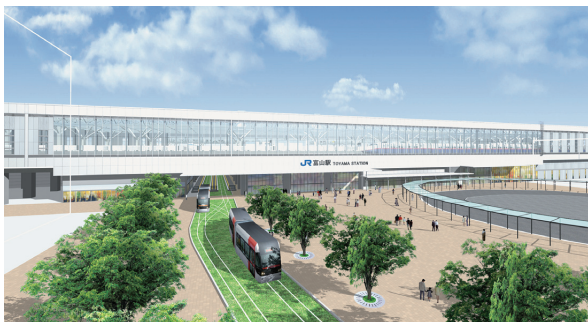
富山駅デザイン案

また、県でも「県民行動計画」を作り、「元気とやまの協働戦略アクションプラン」を策定するため「新幹線戦略とやま県民会議」を設置しました。さらにその下にプロジェクトチームを2つ設け、併せて「地域会議」も設けています。富山県には新幹線の駅が3か所できますが、それぞれの駅を中心とした地域のまちづくりなどさまざまな方策の検討を行っています。黒部駅周辺では「新川地区会議」、富山では「富山地区会議」、高岡では「県西部地区会議」です。この組織のトップには、商工会議所の会頭や顧問が就任し、産官学の方に参加していただき、北陸新幹線の開通後の観光振興や交流促進、産業振興などについて検討を行っています。