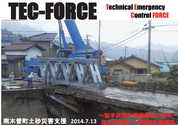
梨子沢橋へ仮橋架設に着手

TEC-FORCE Technical Emergency Control FORCE 南木曾町土砂災害支援 2014.7.13 ~梨子沢橋の仮橋架設に着手~ 国土交通省 中部地方整備局