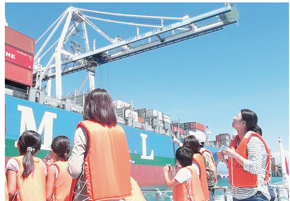
海上からコンテナ船を見学