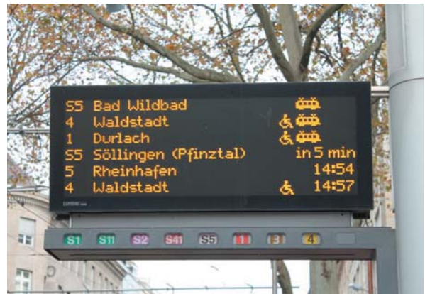
トラムステーションの電光表示（カールスルーエ）

日本でも、紆余曲折はあったものの2013年11月に交通政策基本法が成立し、地域自らが公共交通システムを考え、それを国が支援する枠組みが動き出している。地域の足の確保について、切実な問題を抱え、その解決に自ら取り組もうとしている地域から、まずはさまざまな実例が積み上げられていくことになるが、名古屋のような大都市では、名古屋に通勤通学している住民が居住する周辺自治体との間で組織的な連携を図っていくこと