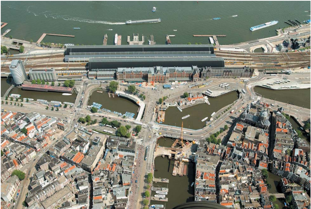
アムステルダム中央駅航空写真