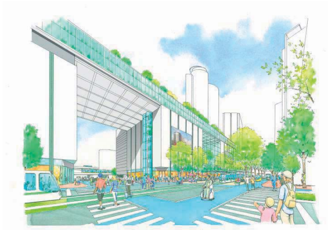
名古屋駅東側 歩いて楽しめる空間 イメージ図 (当財団「リニア中央新幹線の波及効果をより拡大させるために」概要版より)