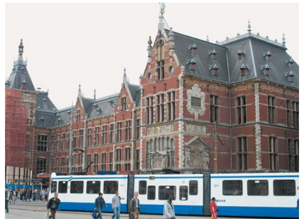
アムステルダム中央駅南側 正面 (Ontwerpboek Stationseilandより)