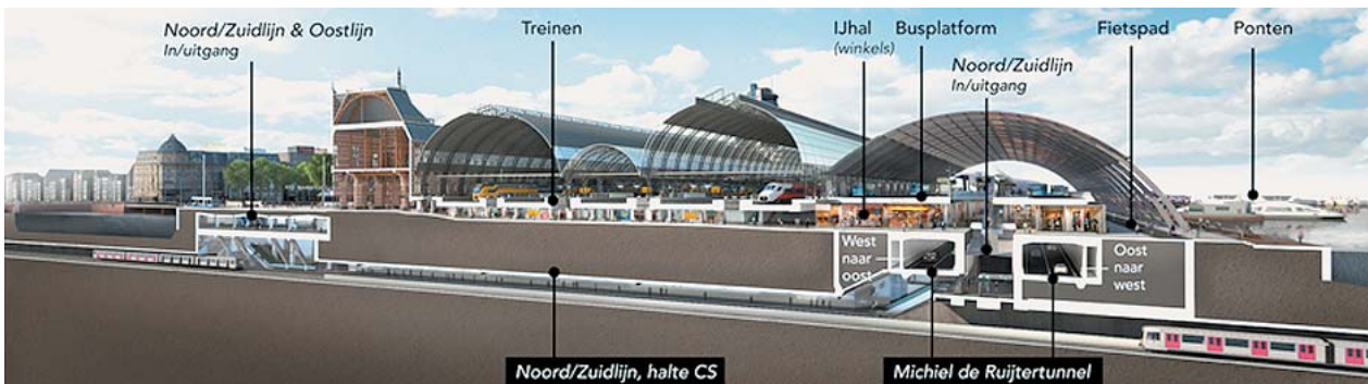
アムステルダム中央駅 断面図 (Amsterdam市のHPより) 左が駅南側、右が北側。北側に道路インフラが集約され、地下には地下鉄南北線が通っている。

駅地区ではさまざまな工事が続き、移動経路が変更になったり、慣れ親しんだ店舗が移動したりすることが多くなるのは確実である。市民にとっても来訪者にとっても、工事期間中は長期にわたって、むしろ駅の利便性や快適性、バリアフリーの度合いが低下するということに対して、事前に十分な情報提供が求められる。できれば、各事業者がそれぞれ対応するのではなく、ICTを活用し、工事情報だけでなく、位置情報や経路確認、最新の店舗情報なども盛り込まれた共通のプラットフォーム