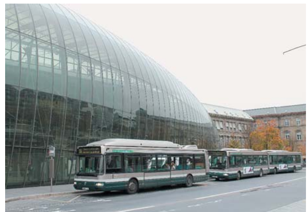
ストラスブール駅前のバスステーション