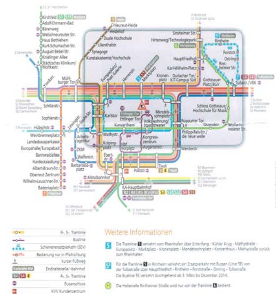
カールスルーエ中心部 路線図

その後も、同システムがカバーする路線網は拡大し続け、郊外から市内へのアクセスが一層向上したものの、市内路線と郊外からの路線が輻輳する中心部では、ラッシュアワー時はひっきりなしに列車が往来して、歩行者が道路を横断するのも容易ではなくなり、現在、市の中心部は地下にトラムを引き入れる工事が始まっている。トラムが地下化された道路上は歩行空間として整備されることである。