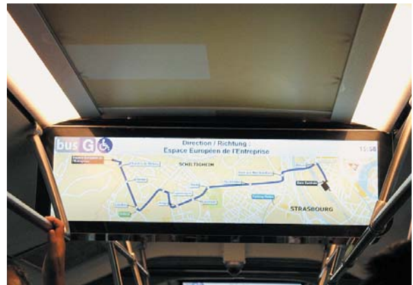
ストラスブールのBRT車内ルート案内

その最大の要因は、運営主体および事業収支の考え方にある。日本では一部の自治体を除き、鉄道もバスも私企業が経営しているが、世界的には日本のような規模で私鉄が展開している国は無いと言ってよい。駅舎と商業施設が一体化した駅ビルも日本特有のもので、名古屋駅も「公共空間」としての駅が、JR東海の駅ビルと名鉄、近鉄の駅ビルなどが一か所に集中立地して大きなひとつの駅を形成している。