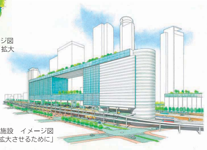
名古屋駅西側 高速道路直結・コンベンション施設 イメージ図 (当財団「リニア中央新幹線の波及効果をより拡大させるために」概要版より)