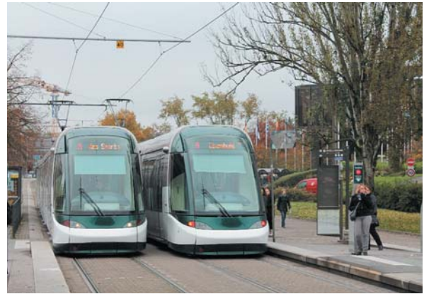
ストラスブール市役所前のトラムステーション

近年、カールスルーエやストラスブールだけでなく、ヨーロッパの諸都市には日本から多くの研究者、行政、首長・議員などが視察に訪れている。国の諸制度の後押しもあって、日本でも富山市などで低床式の新車種が導入されるようになってはきているが、視察団の数ほどには導入事例が増えているわけではない。そこには「国情の違い」が大きく横たわっているように思われる。