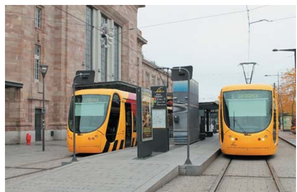
ミュルーズ駅前のトラムステーション

ミュルーズは、スイス・ドイツ国境にもほど近いフランス東部アルザス地方を代表する産業都市であり、人口11万人、都市圏人口が28万人、世界最大の規模を誇る自動車博物館もある。