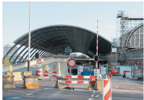
アムステルダム中央駅北側 道路部分

め、多様な主体が複雑に関わる名古屋駅とアムステルダム中央駅とでは単純な比較はできないが、駅南北の役割分担と交通の整流化だけでなく、公共空間としての駅および駅周辺の街づくりに関して、市民や来訪者の視点で計画が策定・公開され、工事が進められる中でマスタープランがさらに練り直されていくプロセスにも学ぶところは多い。