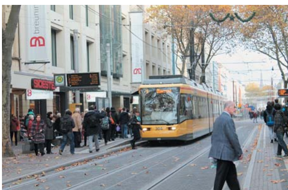
カールスルーエ市内 トラムが行き交う中心街

カールスルーエ運輸連合（KVV：karlsruhe Verkehr Verbund）が、1992年に、それまで不可能とされていた高速の郊外鉄道（train。AC 15,000V）と低速の市内路面電車（tram。DC750V）の双方に対応できる「Sバーン（近距離都市鉄道）」用車両を開発、導入したことにより、郊外から市内まで乗り換えなしで利用できるようになった。料金もゾーン別定額制で運行頻度も高く、非常に利便性が高いシステムとなっており、これらを総称して「カールスルーエ・モデル」とも呼ばれている。