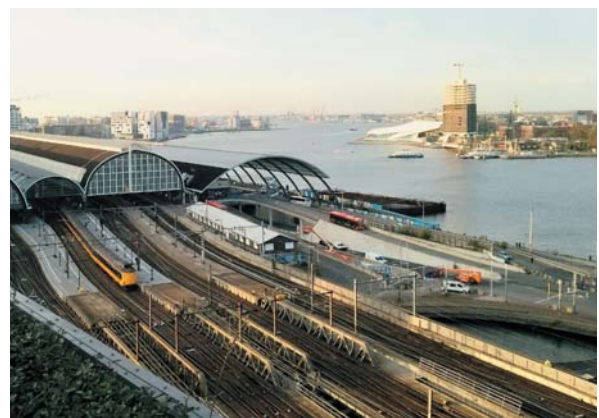
アムステルダム中央駅北側 全景