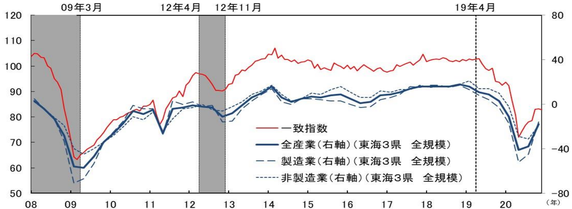
図表6-3 CI一致指数（東海3県、2015年=100）と 日銀短観 業況判断DI（東海3県、%ポイント）の比較

（出所）当財団「中部圏景気動向指数」。日本銀行名古屋支店「東海3県の企業短期経済観測調査」。シャドー箇所は景気後退局面。