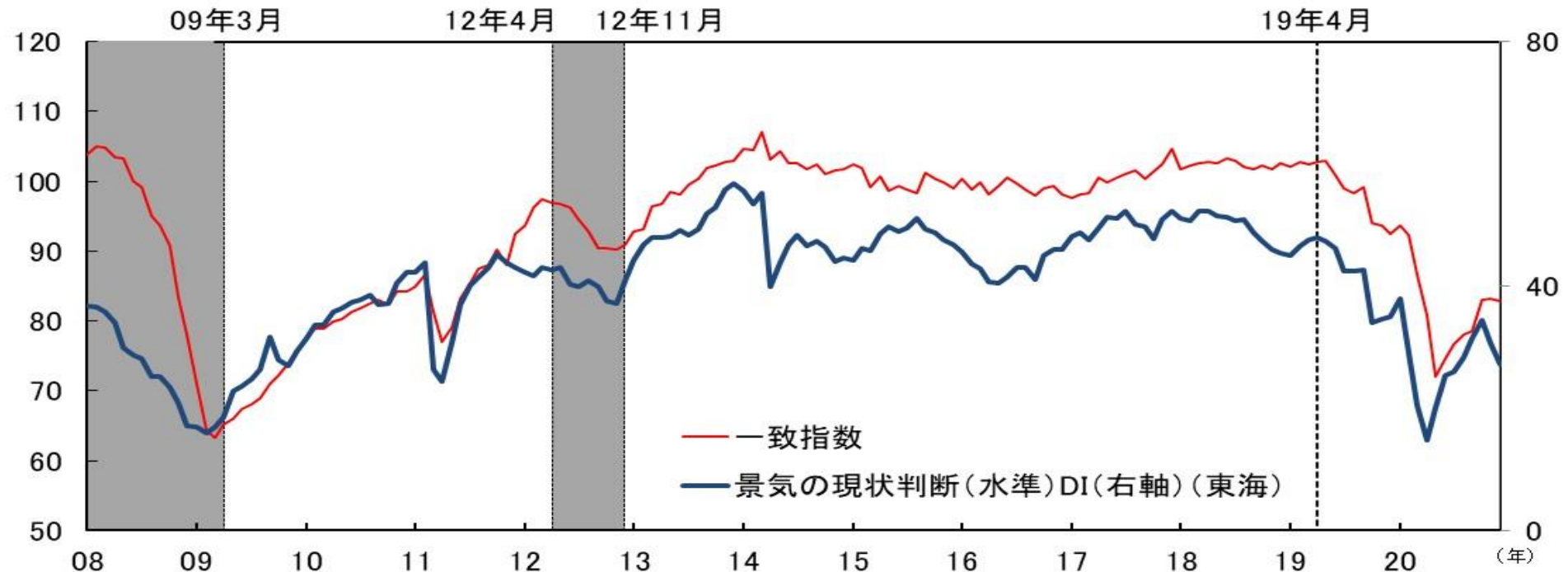
図表 6 - 4 CI一致指数（東海3県、2015年=100）と 景気ウォッチャー調査 景気の状態判断（水準）DI（東海）の比較

(出所) 当財団「中部圏景気動向指数」。内閣府「景気ウォッチャー調査」。シャドー箇所は景気後退局面。