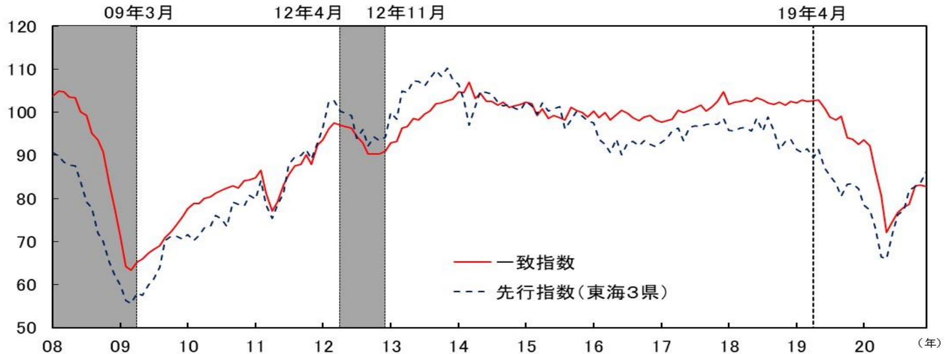
参考図表 2 CI一致指数（東海3県、2015年=100）と CI先行指数（東海3県、2015年=100）の比較