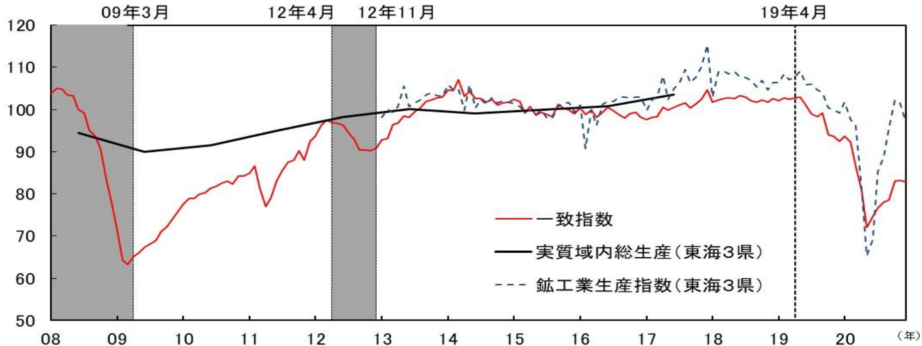
図表6-2 CI一致指数（東海3県、2015年=100）とIIP（東海3県、2015年=100）と実質GRP（東海3県計、2015年=100）の比較