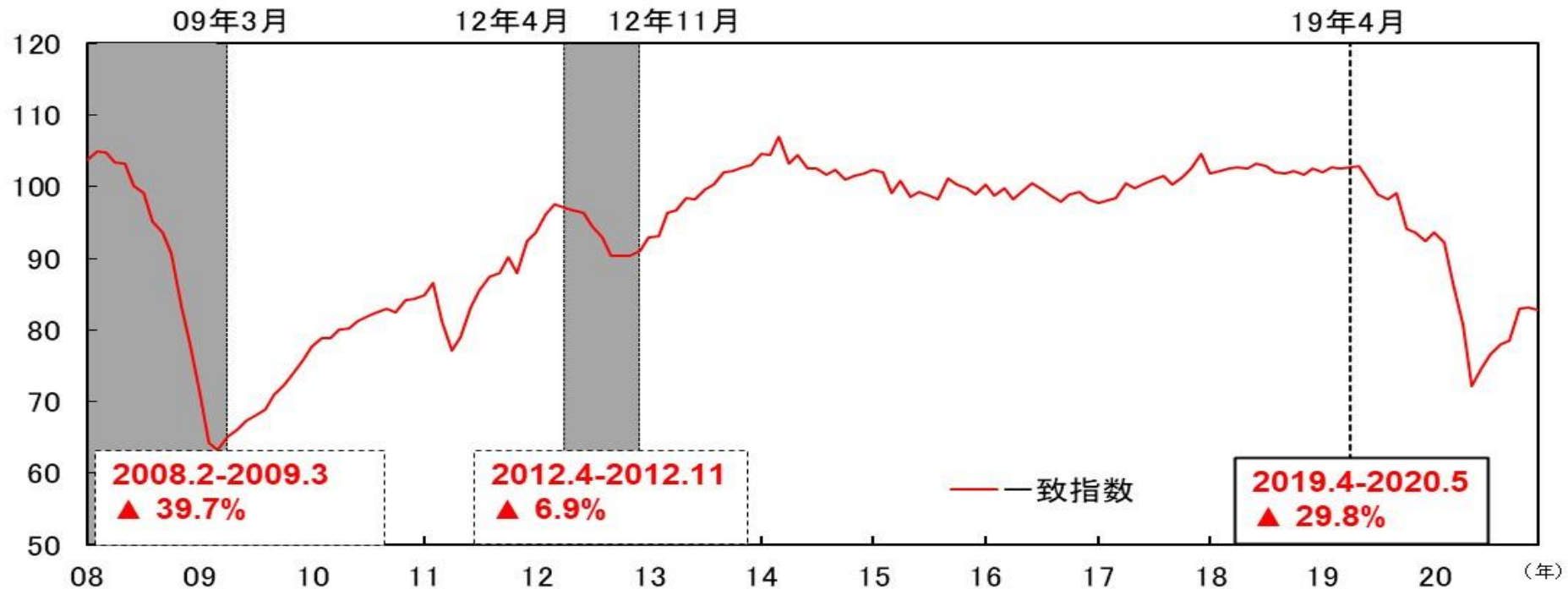
図表4-1 CI一致指数（東海3県、2015年=100） 各後退局面の下降率