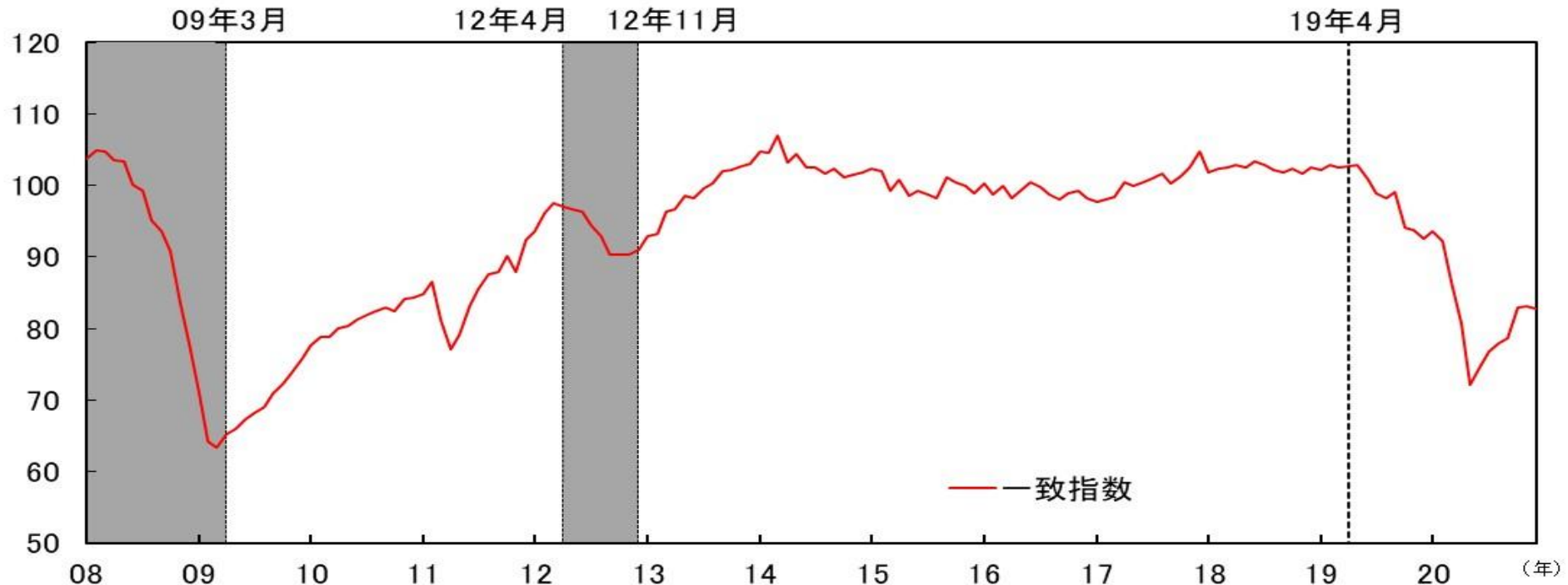
図表1-1 CI一致指数（東海3県、2015年=100）