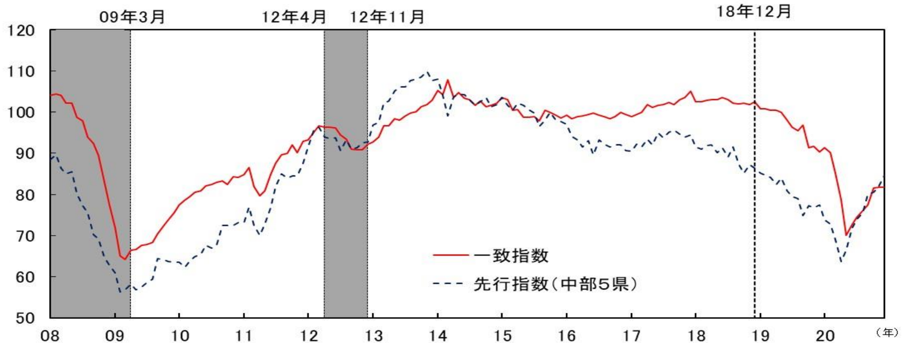
参考図表 2 CI一致指数（中部5県、2015年=100）と CI先行指数（中部5県、2015年=100）の比較