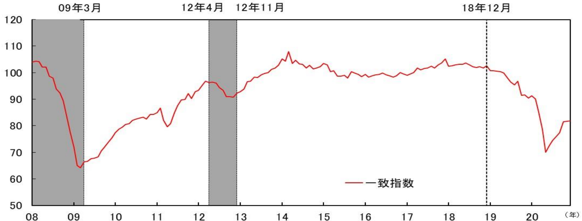
図表 1 - 1 CI一致指数（中部5県、2015年=100）