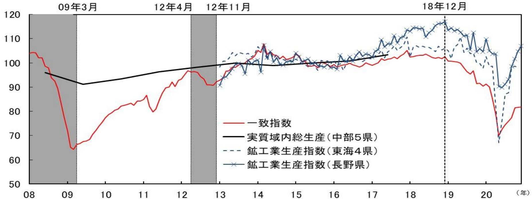
図表6-2 CI一致指数（中部5県、2015年=100）とIIP（東海4県、長野県、2015年=100）と実質GRP（中部5県計、2015年=100）の比較

16 シャドー箇所は景気後退局面。