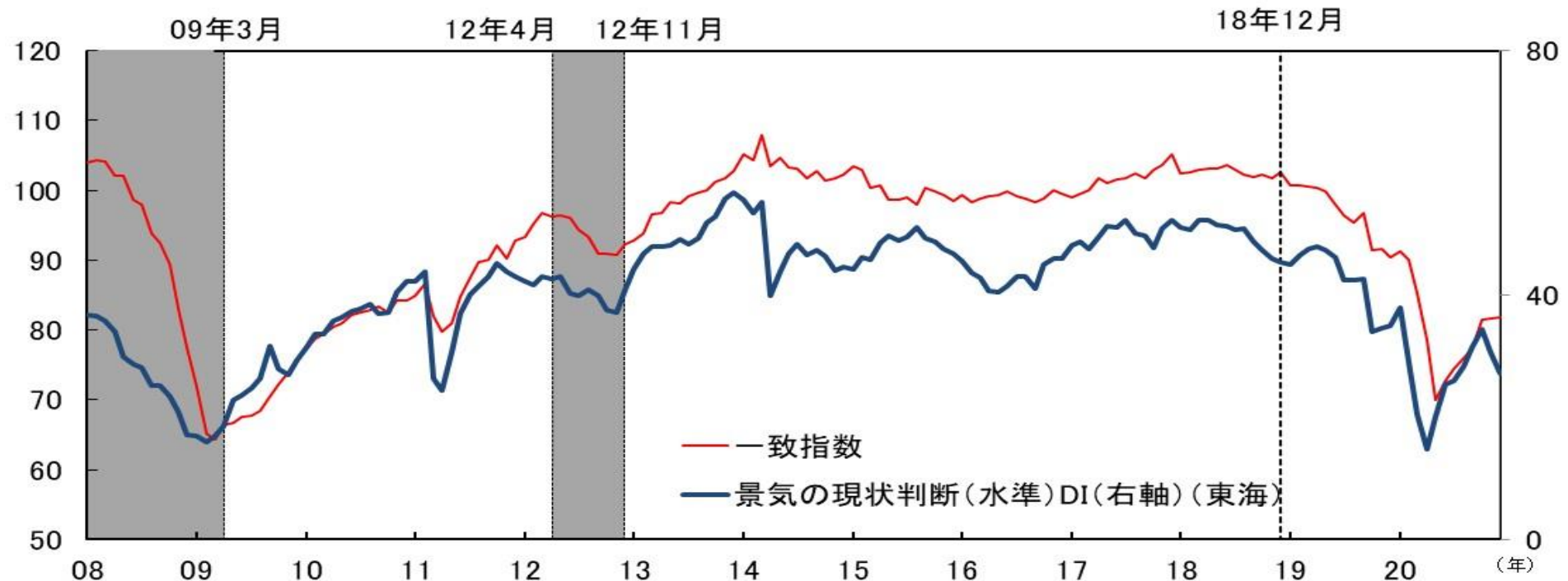
図表 6 - 4 CI一致指数（中部5県、2015年=100）と 景気ウォッチャー調査 景気の状態判断（水準）DI（東海）の比較

シャドー箇所は景気後退局面。