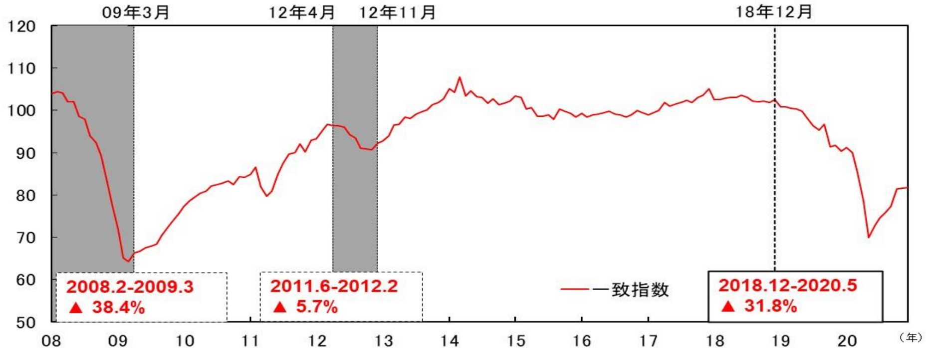
図表4-1 CI一致指数（中部5県、2015年=100） 各後退局面の下降率