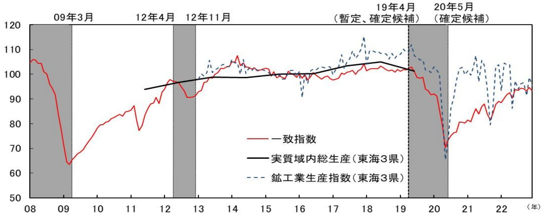
図表6-2 CI一致指数（東海3県、2015年=100）とIIP（東海3県、2015年=100）と実質GRP（東海3県計、2015年=100）の比較