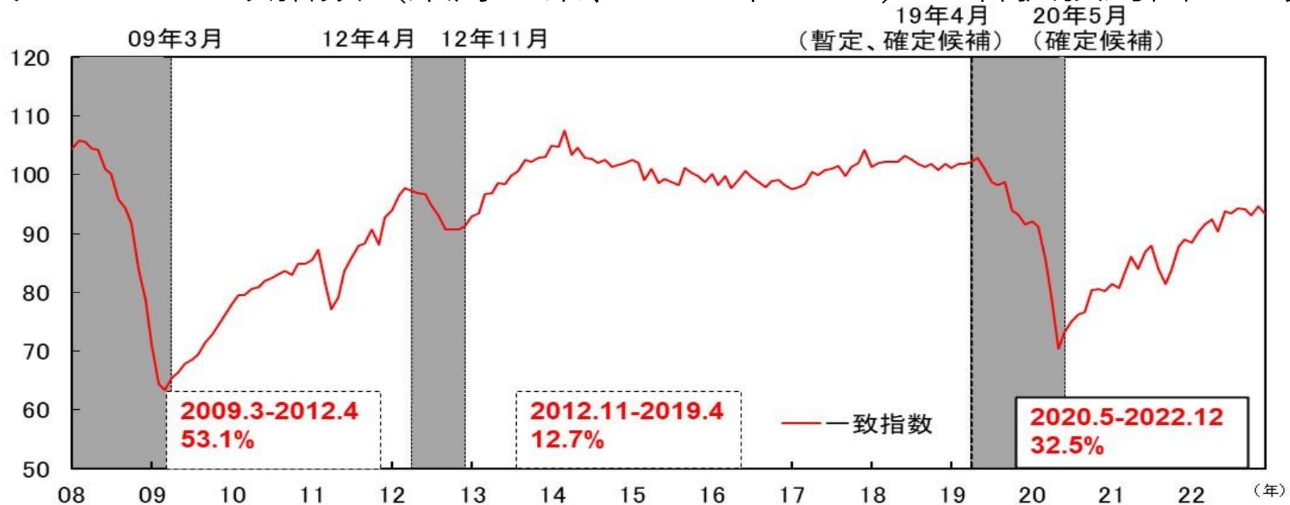
図表4-2 CI一致指数（東海3県、2015年=100） 各拡張局面の上昇率