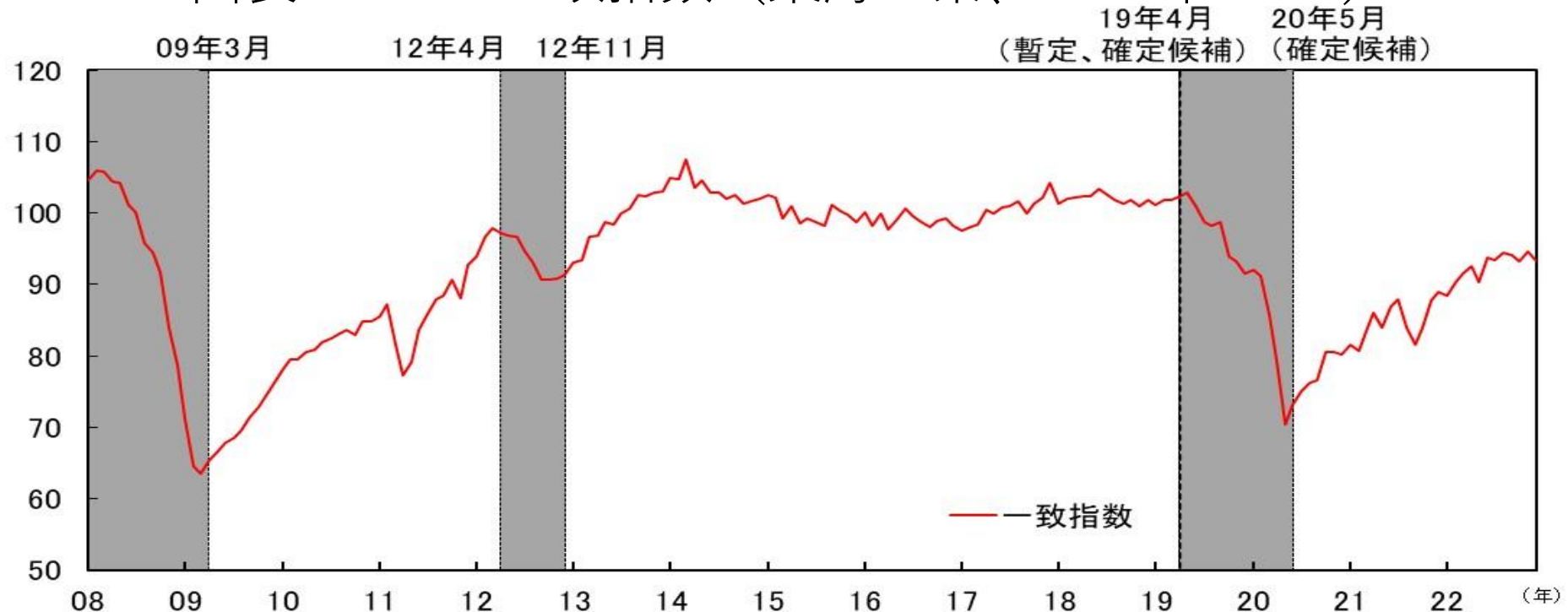
図表 1 - 1 CI一致指数（東海3県、2015年=100）