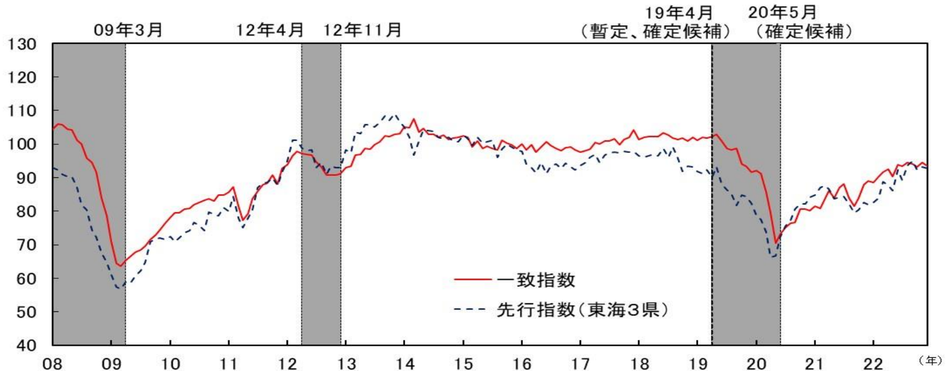
参考図表 CI一致指数（東海3県、2015年=100）と CI先行指数（東海3県、2015年=100）の比較