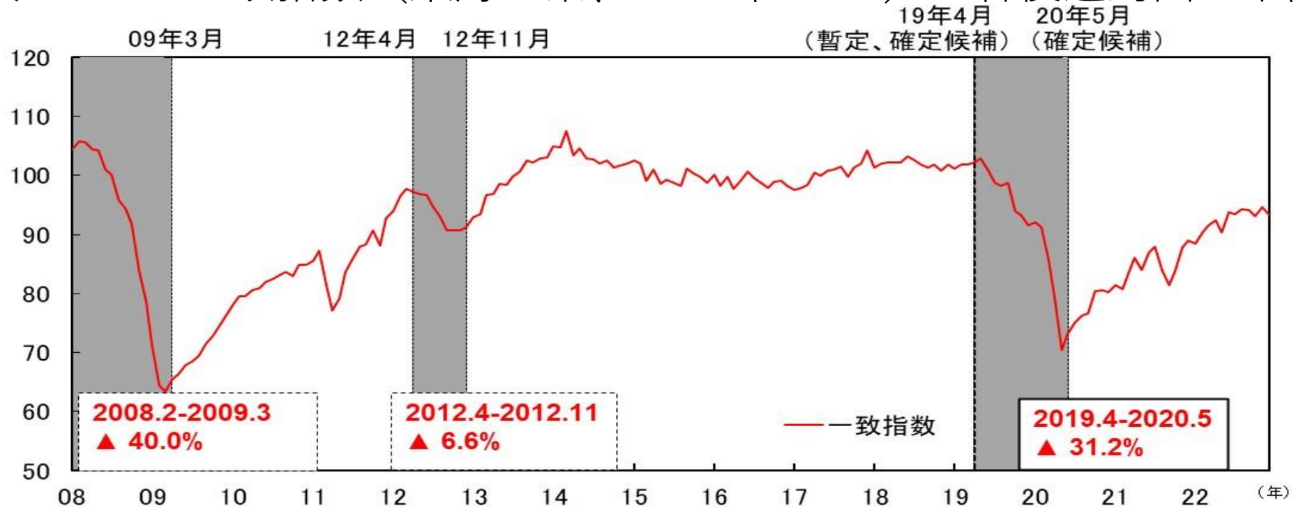
図表4-1 CI一致指数（東海3県、2015年=100） 各後退局面の下降率