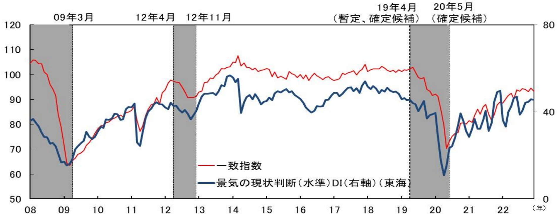
図表 6 - 4 CI一致指数（東海 3 県、2015年=100）と 景気ウォッチャー調査 景気の状態判断（水準）DI（東海）の比較