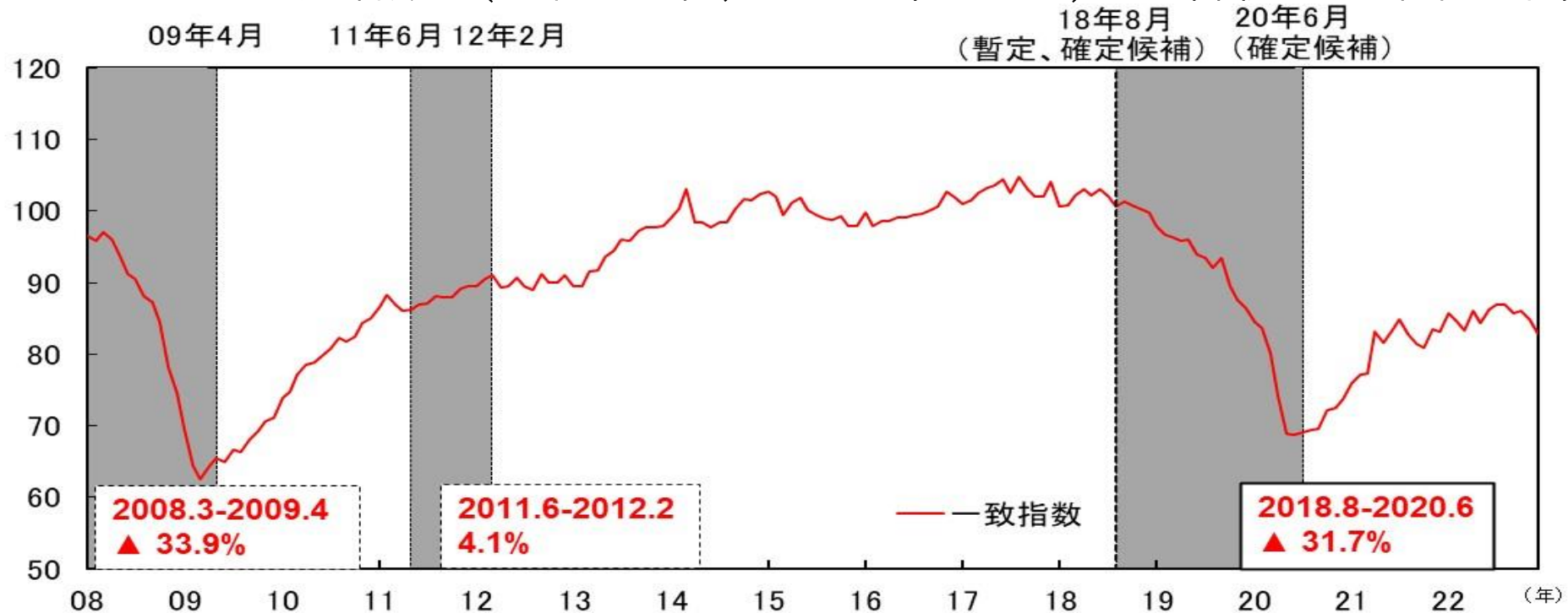
図表4-1 CI一致指数（北陸3県、2015年=100） 各後退局面の下降率