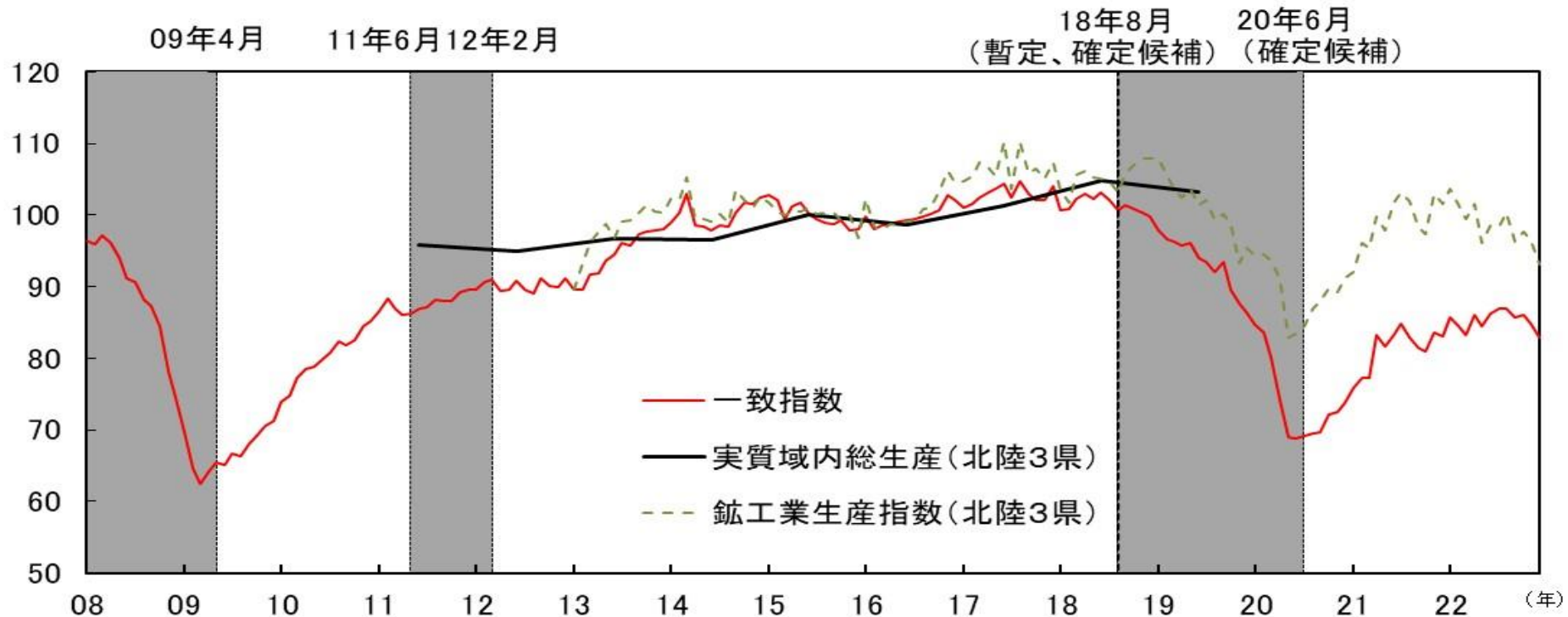
図表6-2 CI一致指数（北陸3県、2015年=100）とIIP（北陸3県、2015年=100）と実質GRP（北陸3県計、2015年=100）の比較