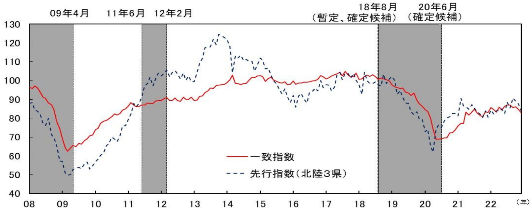
参考図表 CI一致指数（北陸3県、2015年=100）と CI先行指数（北陸3県、2015年=100）の比較