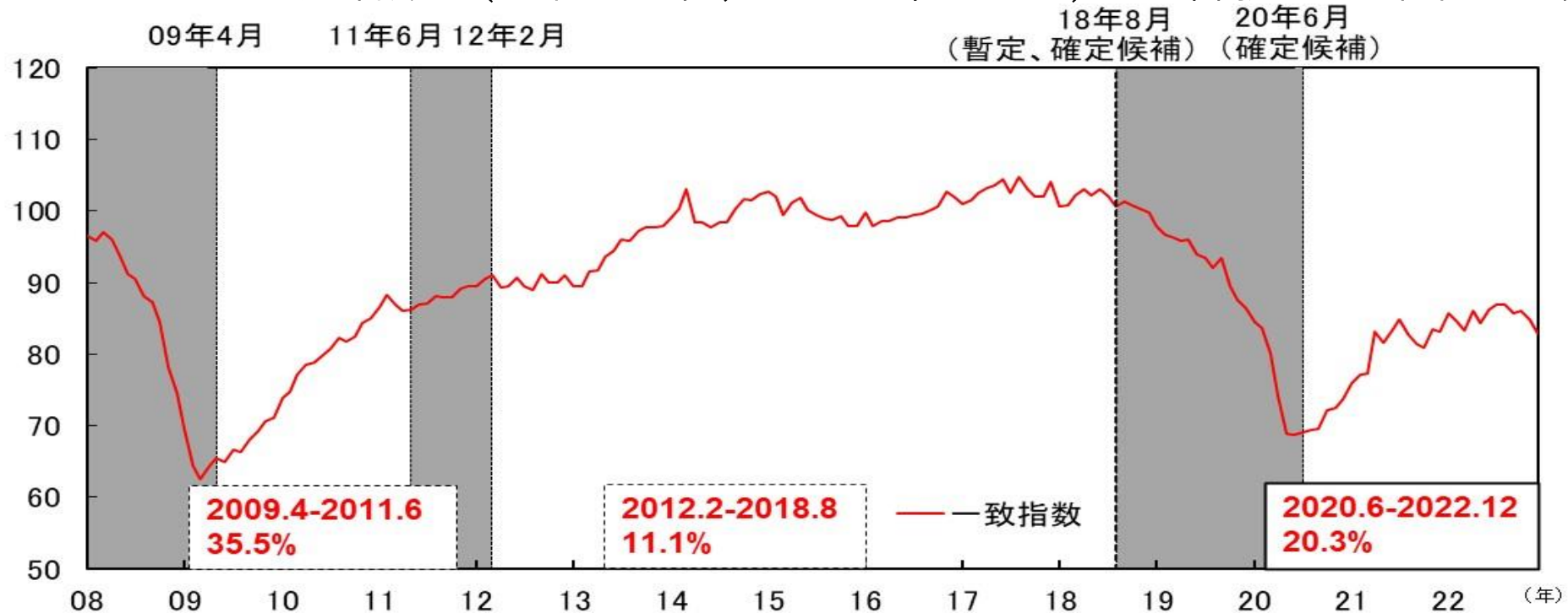
図表4-2 CI一致指数（北陸3県、2015年=100） 各拡張局面の上昇率