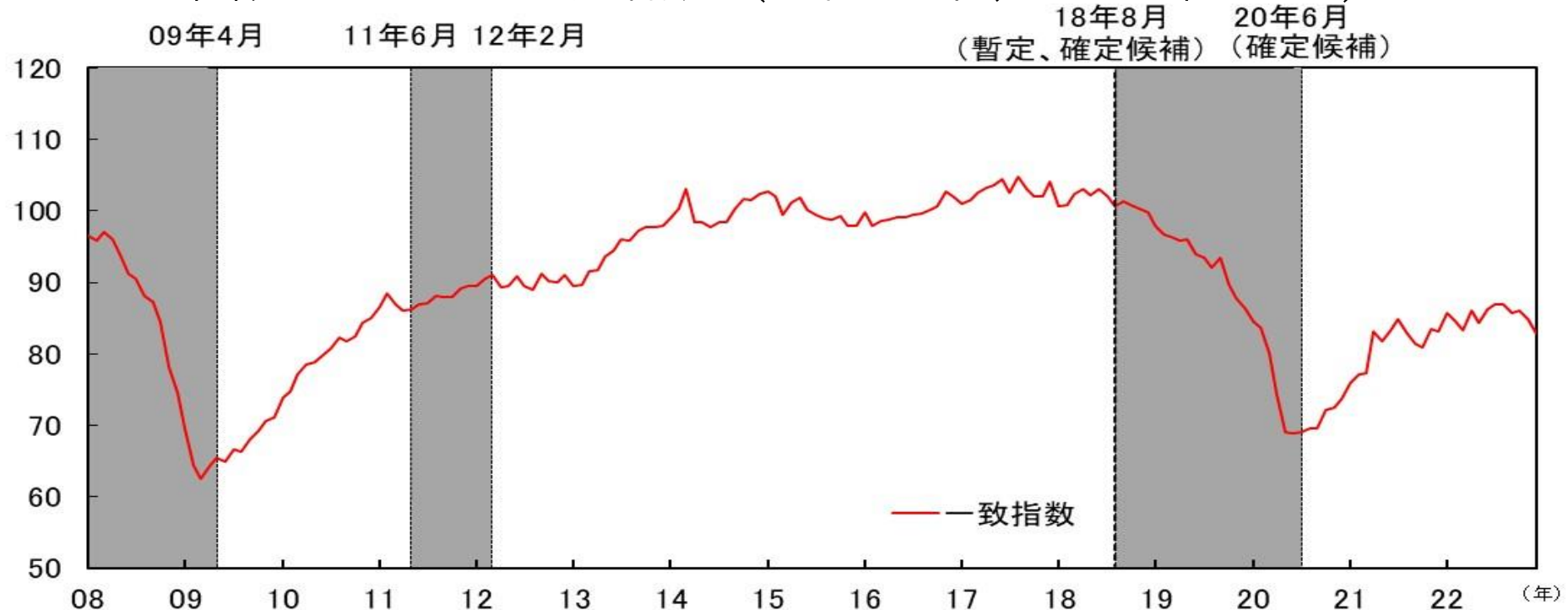
図表 1 - 1 CI一致指数（北陸3県、2015年=100）