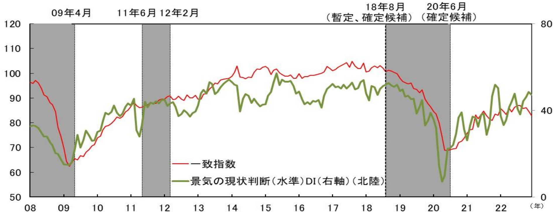
図表 6 - 4 CI一致指数（北陸3県、2015年=100）と 景気ウォッチャー調査 景気の状態判断（水準）DI（北陸3県）の比較